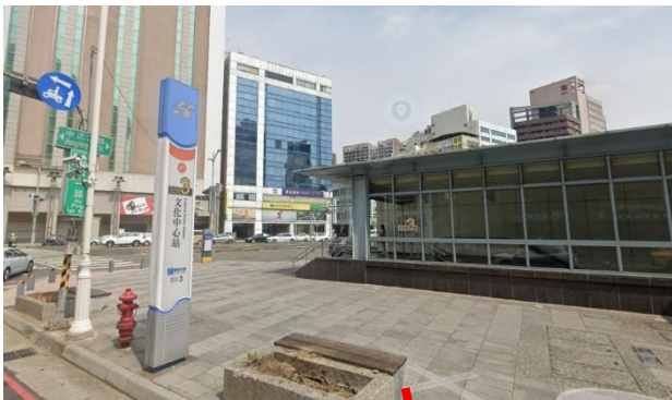
文化中心 3 號出口