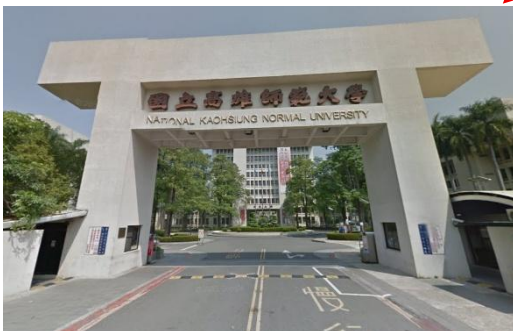
國立高雄師範大學 (地址：高雄市苓雅區和平一路 116 號)