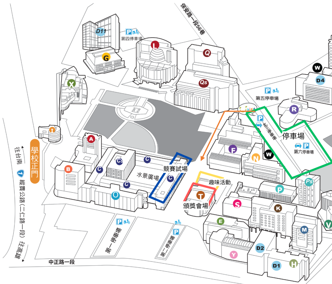
圖1、活動會場動線圖